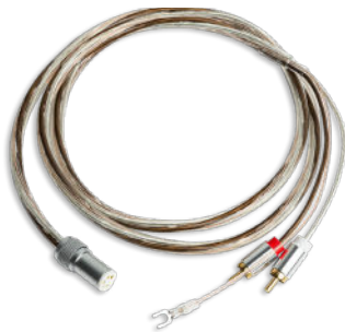
Inkl. Connect it Phono E 5P/RCA: Semi-symmetrisches Premium Phonokabel