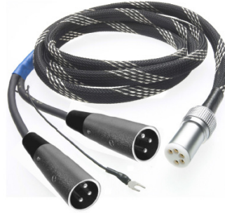
Connect it Phono DS 5P/XLR: separat erhältliches Upgrade-Kabel für True Balanced Phono-Verbindungen