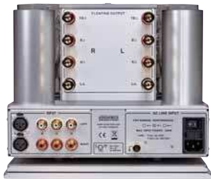
Auf der Rückseite gibt es neben den vier Eingängen eine zusätzliche Erdungsbuchse sowie einen Netzhauptschalter

Ansonsten benötigt der 300i keinerlei Aufmerksamkeit, obgleich alle Blicke natürlich immer an dem optisch reizvollen, im für Nagra typischen Spannungsfeld zwischen technischer Coolness und knuddeliger Niedlichkeit gestalteten Geräten hängen. Von der Soft Start-Automatik beim Einschalten bis zur diskreten Überwachung der Kreise wurde auf höchste Betriebssicherheit geachtet. Selbst unter maximaler Belastung während der Leistungsmessung im La-