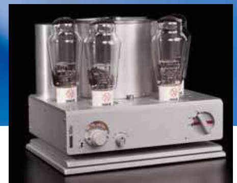
Die Endstufen-Version 300p – hier ohne Glastuben – kommt mit weniger Bedienelementen aus

Und ein absolut zeitloser dazu. Denn der rund 14 Kilogramm schwere 300i – ohne Fernbedienung, Lautstärke- und Balanceregler sowie Eingangsumschaltung auch als Stereo-Endstufe 300p (um