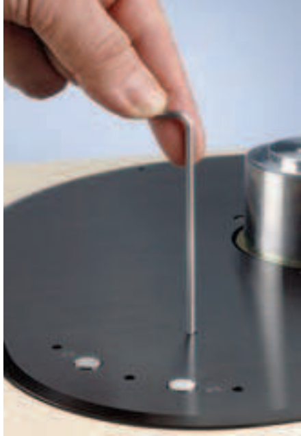
Klanglich extrem wichtig sind die Stellfläche oder Füße direkt unter den höhenverstellbaren Spikes

Hebt man den Oasis erstmals hoch, staunt man: Auf 27 Kilogramm kommt der Spieler mit seinem zehn Kilo schweren Teller und dem massiven Aufbau – lediglich sechs Kilo weniger als das vergleichsweise monumental wirkende LaGrange-Laufwerk. Aber das ist mal wieder ein typisches Brinkmann-Ergebnis: Ziel der Entwicklung war ein kleiner, günstiger Plattenspieler, dann sprechen verschiedene klangliche Notwendigkeiten für einen schweren Teller. Und schon bewegt man sich in einem Entwicklungsstrudel, der her-