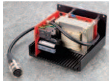
Das Netzteil muss wegen des hohen Anschubstroms noch auf eine Röhren-Alternative warten

auftritts bei gleichzeitig extremer Lebendigkeit und feinsten Farbzeichnung hat sich der LaGrange einen Ruf erworben, den Brinkmanns älteres Top-Laufwerk, der Balance, mit seiner ungemein wuchtigen, manchmal jedoch etwas kolossal-behäbig wirkenden Spielweise nicht erringen konnte: für alle Arten von Musik gleichermaßen geeignet zu sein.