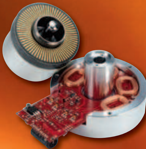
Direktantrieb mit Spulen und Antriebselektronik im Alu-Block, wartungsfreies Ölbad-Wälzlager, darüber der Ringmagnet mit Tachoscheibe

Eine Freundin, die mit der Fotografin Herlinde Koelbl zusammenarbeitet, stand eines Tages wie angewurzelt vor dem Spieler, bestaunte ihn fasziniert: „Ist der schön!“ Doch das Sichtbare hat nicht nur eine optische Wirkung, es besitzt auch einen klanglichen Hintergrund. Die abgerundeten Ecken mögen Assoziationen an Kunstwerke wecken oder Plattenspieler-Liebhaber an die Rundungen des klassischen Thorens 124er, einen